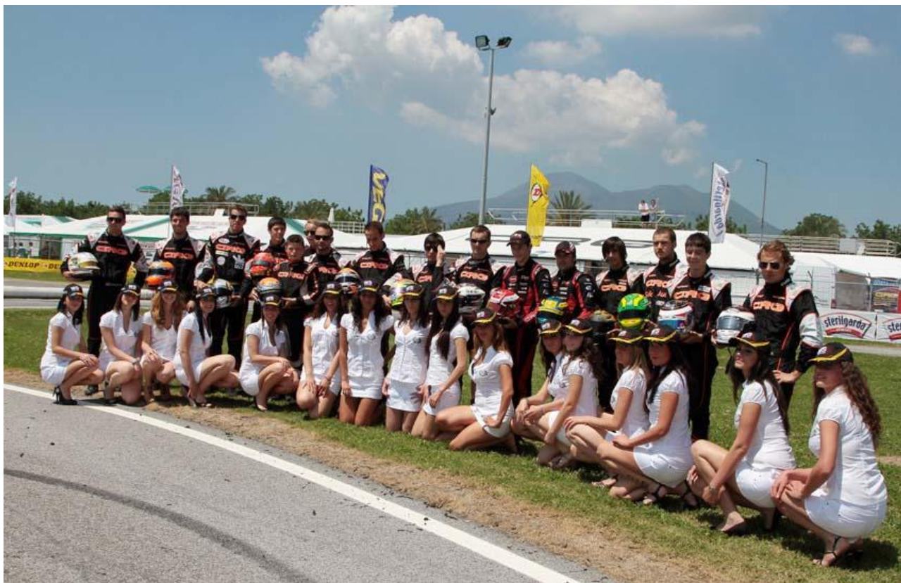
I piloti CRG al Circuito Internazionale Napoli di Sarno per la prova conclusiva del WSK Euro Series 2010.